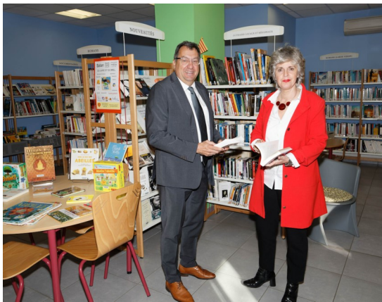
Visite de la bibliothèque

Cependant, au-delà des attraits du village, les élus ont fait part de leurs préoccupations. Le maire a évoqué la perte des commerces alimentaires de proximité, un sujet sensible pour une commune qui souhaite maintenir un dynamisme économique répondant aux besoins des habitants. « Il est essentiel de retrouver une économie de proximité afin de renforcer le lien social et d'offrir des services adaptés à notre population », a souligné le maire.